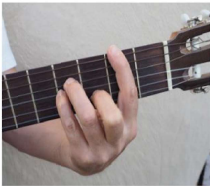
Sim / Bm